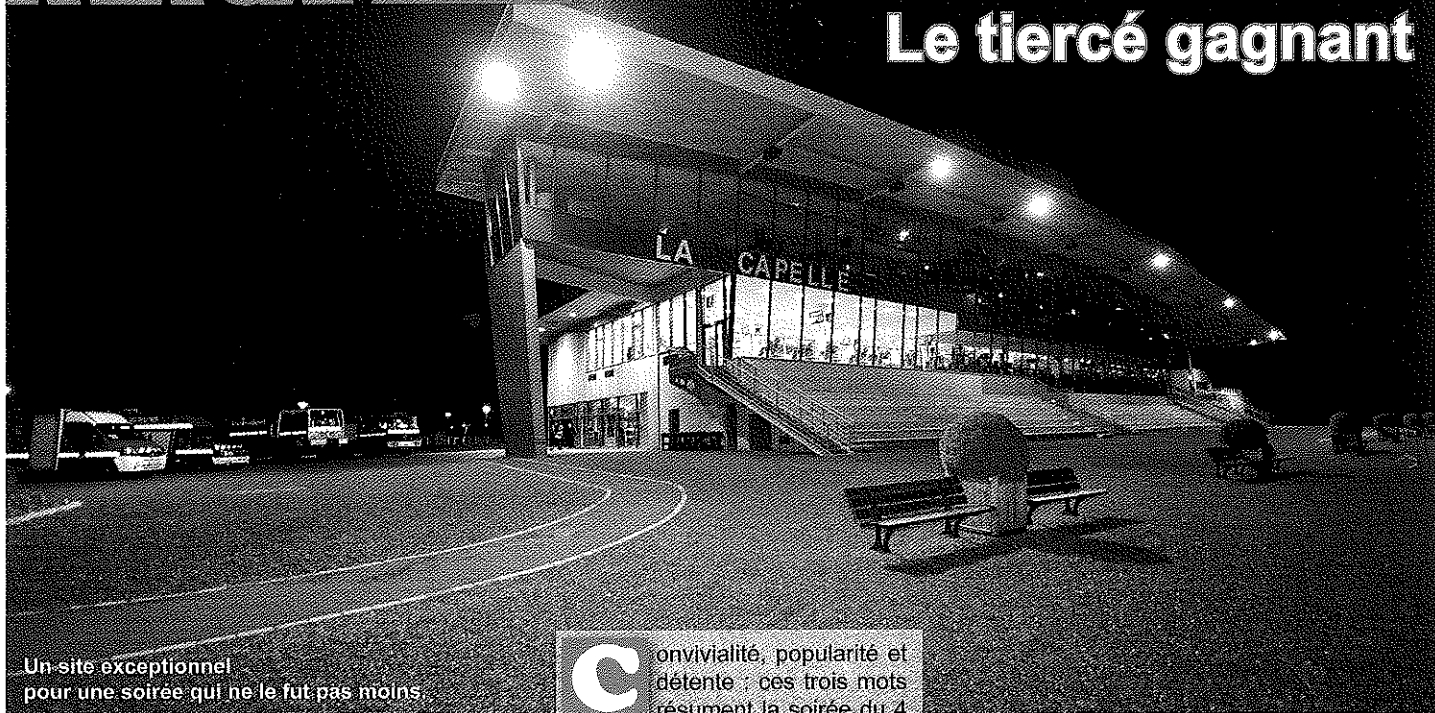
Un site exceptionnel pour une soirée qui ne le fut pas moins.

C onvivialité, popularité et détente : ces trois mots résument la soirée du 4 décembre 2009 à l'occasion de la 2 e Sainte Barbe Départementale.