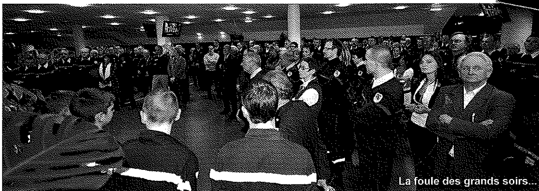
La foule des grands soirs...