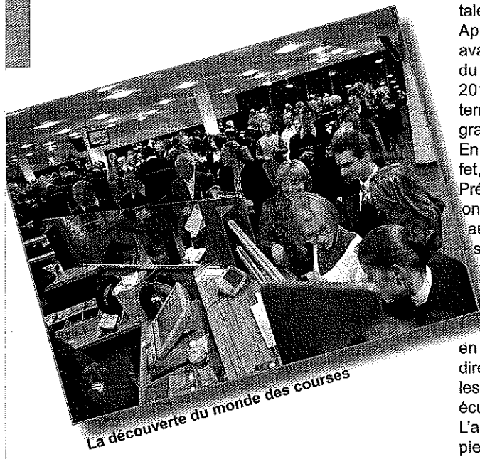
La découverte du monde des courses