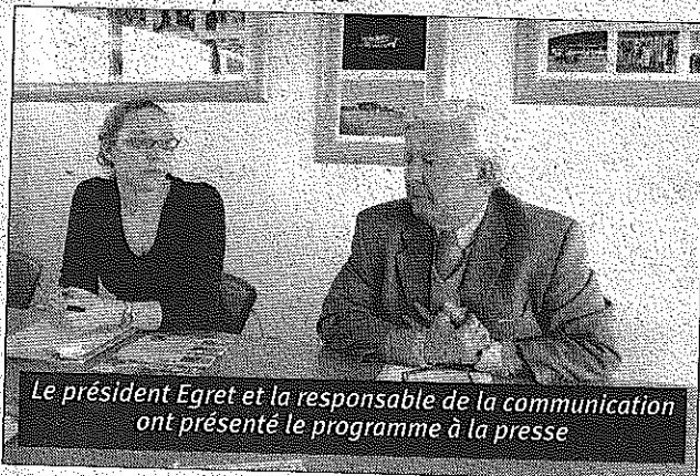
Le président Egret et la responsable de la communication ont présenté le programme à la presse